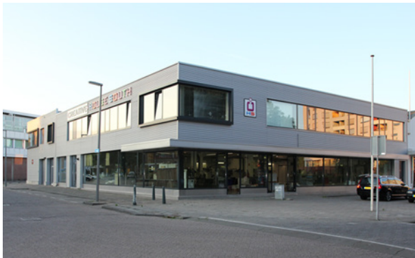
Een afbeelding met een resolutie van 150 DPI